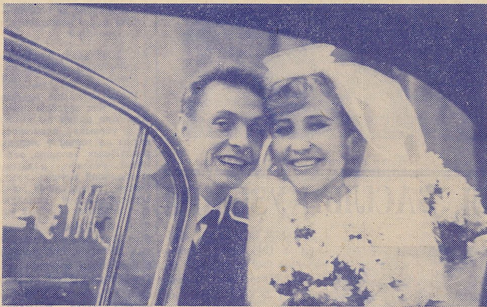
Ім мінулы год прынёс асаблівае шчасце.