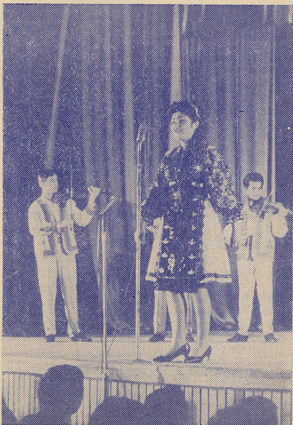
Госці на сцэне.

— З выпадку Новага года мы жадаем студэнтам Беларускага дзяржаўнага ўніверсітэта самых лепшых поспехаў у здачы экзаменаў, якія тут, як і ўсюды, пачынаюцца адразу ж пасля Новага года! Жадаем ім добрага здароўя і найлепшых поспехаў у жыцці! Надоўга зберажам цяпло, якім акружалі нас у вашым ўніверсітэце!